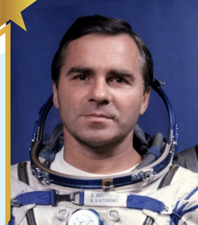
ВИКТОРЕНКО Александр Степанович

Советский военный строитель, один из создателей ракетно-космического комплекса СССР, Председатель Президиума Межгосударственного Союза городов-героев, Генерал-лейтенант, Герой Социалистического Труда.