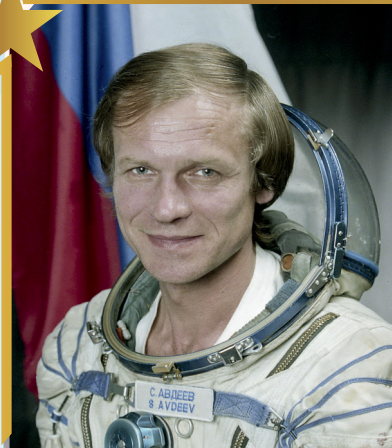
АВДЕЕВ Сергей Васильевич

Советский космонавт, экс-рекордсмен мира по суммарному времени пребывания в космосе (747 суток). Почётное звание «Лётчик-космонавт Российской Федерации», Действительный член «Федерации космонавтики России», Герой РФ.