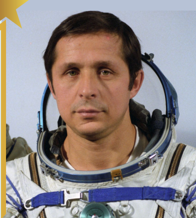
САВИНЫХ Виктор Петрович

Первый заместитель Секретаря Общественной Палаты РФ, Герой РФ.