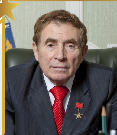
ЛЁВИН Алексей Гаврилович

Советский космонавт, экс-рекордсмен мира по суммарному времени пребывания в космосе (747 суток). Почётное звание «Лётчик-космонавт Российской Федерации», Действительный член «Федерации космонавтики России», Герой РФ.