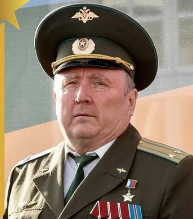
ЧУХВАНЦЕВ Валерий Николаевич

Российский космонавт 1-го класса, 6 выходов в открытый космос, лётчик-испытатель, полковник ВВС России, Герой Советского Союза.